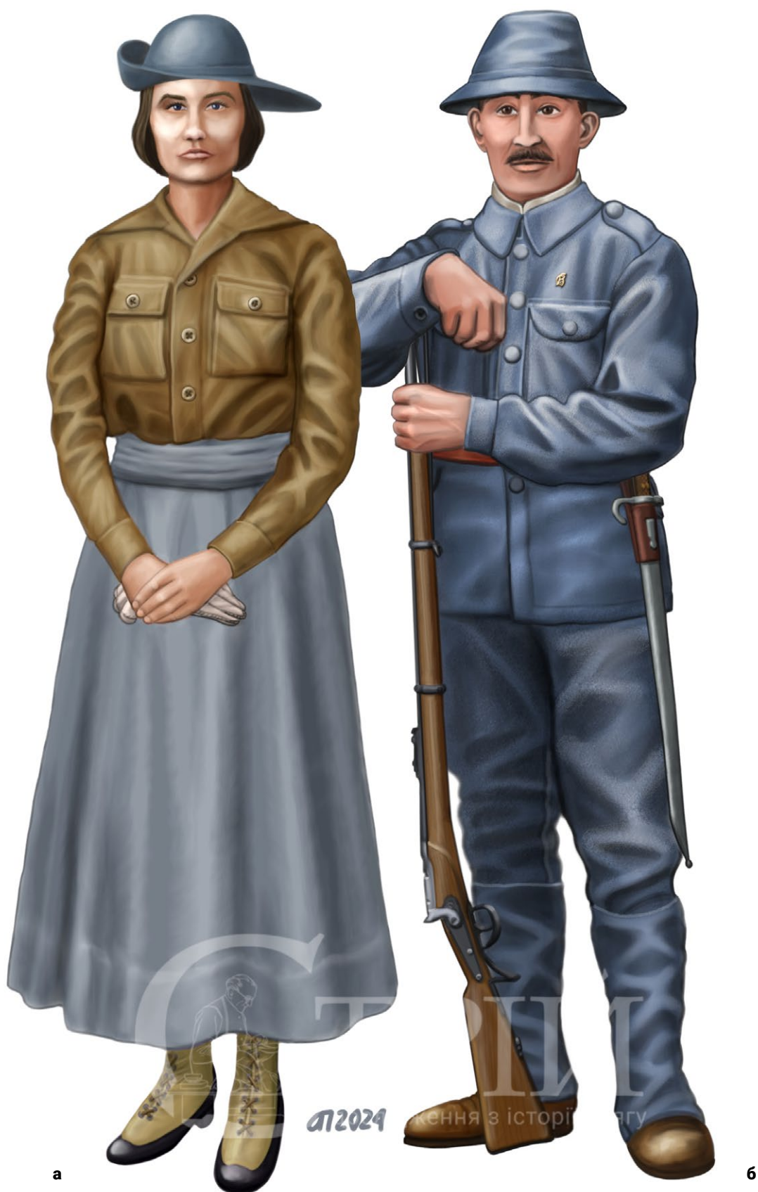
Мал. 2. Однострії членів товариства «Січові стрільці II», 1914 р.: (а) – членка жіночої чети; (б) – стрілець, 1914 р. Жіночий однострій складається з сорочки, спідниці і капелюха, заломленого з одного боку. Стрілець одягнений в однострій кольору «hechtgrau»: капелюх з невеликими обвислими крисами, кітель, штани і гамаші. Зброя – застаріла на той час гвинтівка системи Верндля зразка 1867 р.